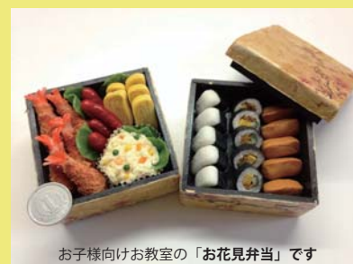
お子様向けお教室の「お花見弁当」です

※先着8名様限定です。 ※駐車場がありませんので、お近く の100円パーキングをご利用下さい。