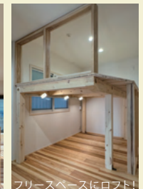
暖かい日差しが差し込むLDK