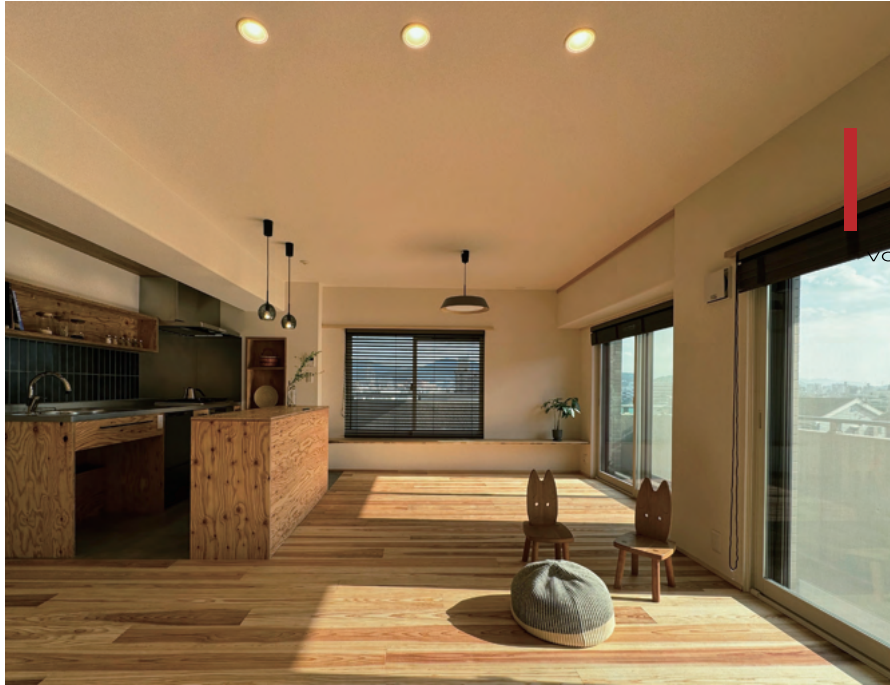
広島市安佐南区 スタッフ自邸マンションリノベーション