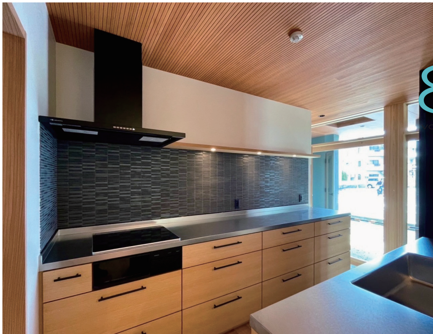
Holzhaus 1階 gallery様